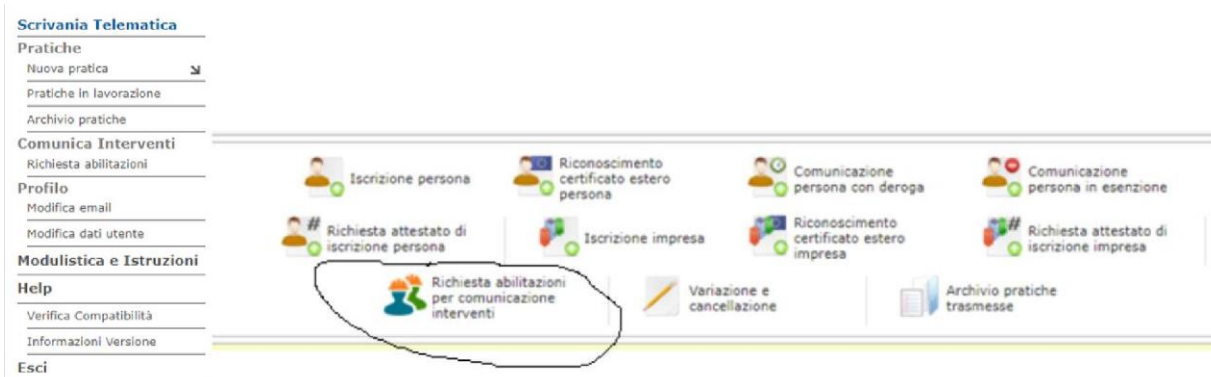
Abbildung 4 - Antrag um Berechtigung