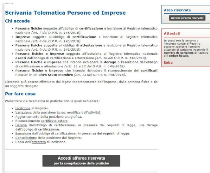
Abbildung 2 - Zugang zur Benutzerfläche

Der Zugang zur Benutzerfläche erfolgt entweder mit der digitalen Unterschriftsvorrichtung oder mit der digitalen Identität SPID des gesetzlichen Vertreters des Unternehmens oder einer von ihm bevollmächtigten Person.