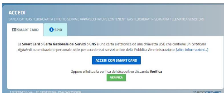
Abbildung 3 - Wahl des Zugangs

Auch wenn der Zugang über SPID erfolgt, braucht es zum Abschluss des Antrags auf jeden Fall die digitale Unterschrift des Inhabers der digitalen Identität SPID.